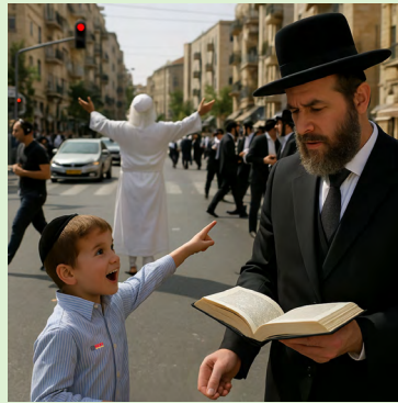
עיצוב AI: ספי רייקינד

שלהי סדר א' ובית המדרש מלא, חשמל באוויר, בחורים שקועים בתורה. אלהו בירר מיהו הגבאי ופנה אליו, אפשר להודיע על ביאת משיח? הגבאי החביב התקפד, משיח? מי אתה? מי שלח אותך? מי המשיח? על מה אתה מדבר? החסרי משוגעים אנחנו? תפסיקו להמציא משיחים, זה נמאס! אלהו