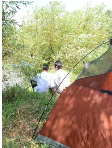
הכנסת אורחים

תשובה: בשולחן ערוך כתוב "מי שנותנים לו לברך ואינו מברך, מקצרים ימיו", ולפי זה יוצא שהמסרב לכיבוד שכבודו לזמן מכניס עצמו לסכנה. אולם בפוסקים מבואר שההקפדה כי